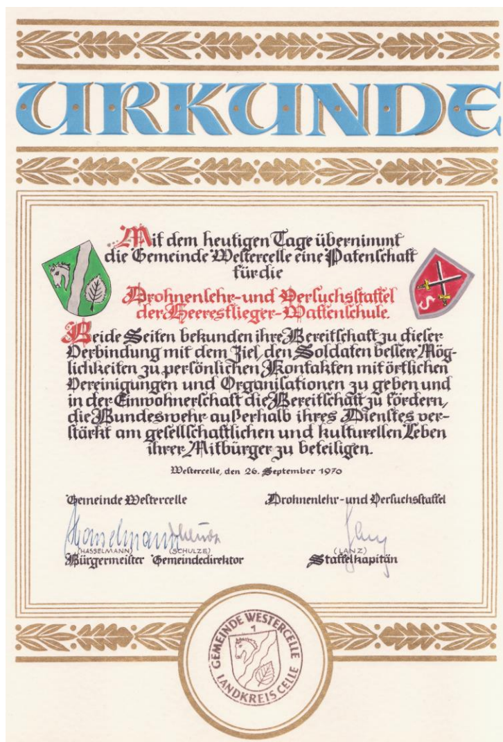
Abb. 1: Patenschaftsurkunde zwischen der Drohnen Lehr- und Versuchsstaffel und der Gemeinde Westercelle vom 26.09.1970.